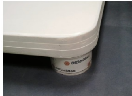
(Figure 3) Table Setup (optional)