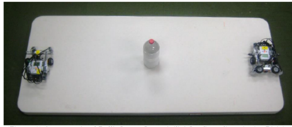
(Figure 1) An example of BottleSumo Game Initial Configuration, Junior Division