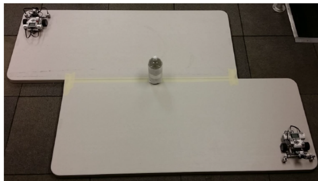
(Figure 4) An example of one possible Sr. Division table configuration. Two tables are taped together with masking tape. The exact color of the tape is unknown.